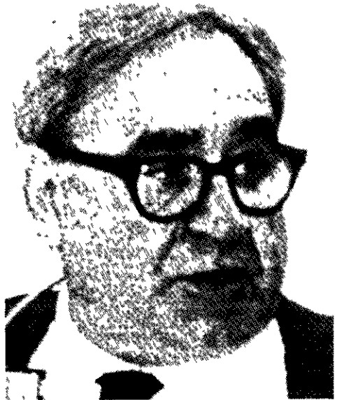
Robert W Fogel

Ekonomiämnet bör givetvis ha en inriktning mot empiri. Det har blivit allt mer uppenbart, att ämnet bör ha en solid bas i historisk kunskap. Ämnet kan utvecklas och göras mera relevant endast om teorin kopplas till sk riktningbestämd forskning, dvs har en tidsdimension, eftersom framför allt prognoser bör höra samman med temporal analys, eller med andra ord, med ekonomisk historisk forskning. Schumpeter angav tre skäl härtill: (1) the subject matter of economics is essentially a unique process in historic time... (2) the historical report cannot be purely economic but must inevitably re-